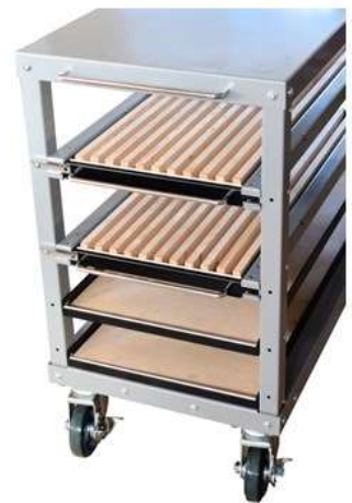
■ K-2VBR 仕切幅 21mm (1.2段目とも) ・コマツ用2Vダイ