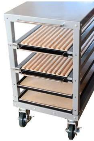
■ A-2VBR 仕切幅 16mm (1.2段目とも) ・アマダ2Vダイ ・東洋工機用