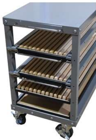
■ K-1VBR 仕切幅 21mm (1.2段目とも) (3段目仕切16mm) ・コマツ用