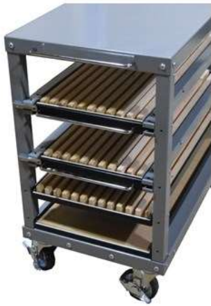
■ A-1VBR 仕切幅 16mm (1.2.3段目とも) ・アマダ・ムラタ用