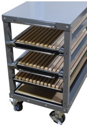
■ A-1VBR 仕切幅 16mm (1.2.3段目とも) ・アマダ・ムラタ用