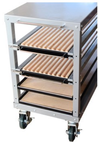
■ K-2VBR 仕切幅 21mm (1.2段目とも) ・コマツ用2Vダイ